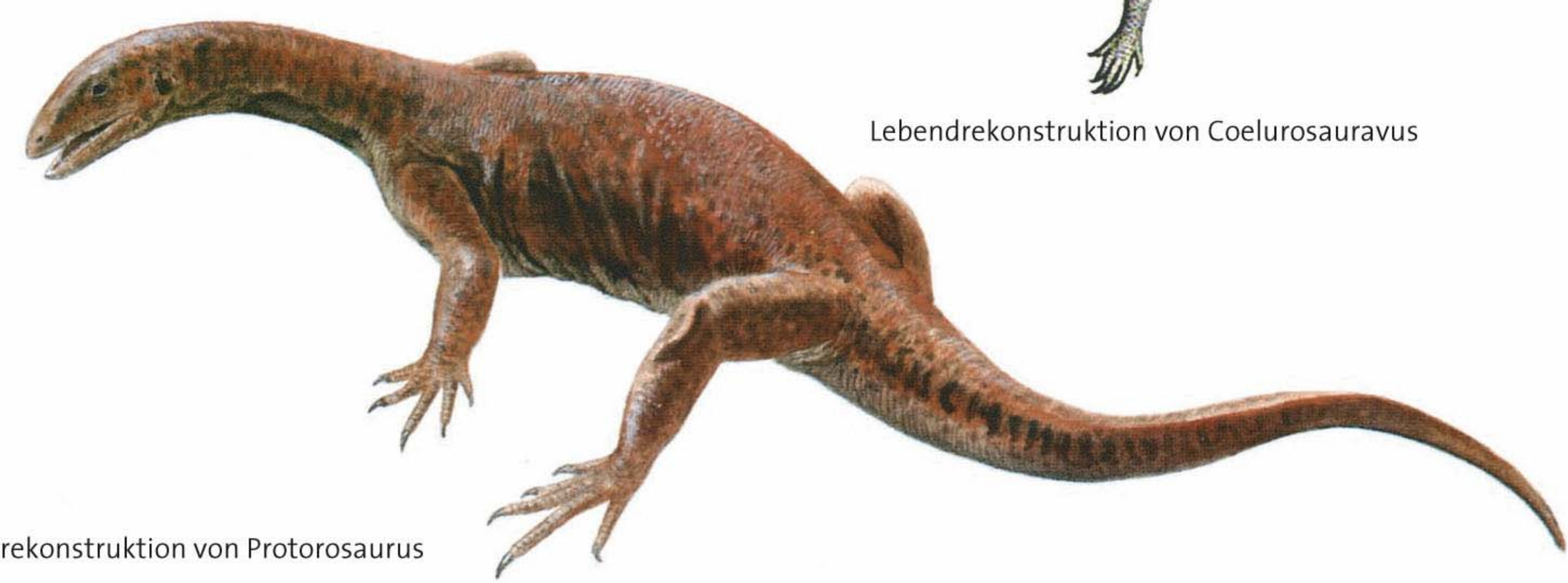
Lebendrekonstruktion von Protorosaurus

Da die Zähne von Protorosaurus nicht für die Zerkleinerung pflanzlicher Nahrung geeignet sind, könnten diese Gerölle als Magensteine zum Aufschließen der Nahrung gedient haben, wie wir es von den Krokodilen kennen.